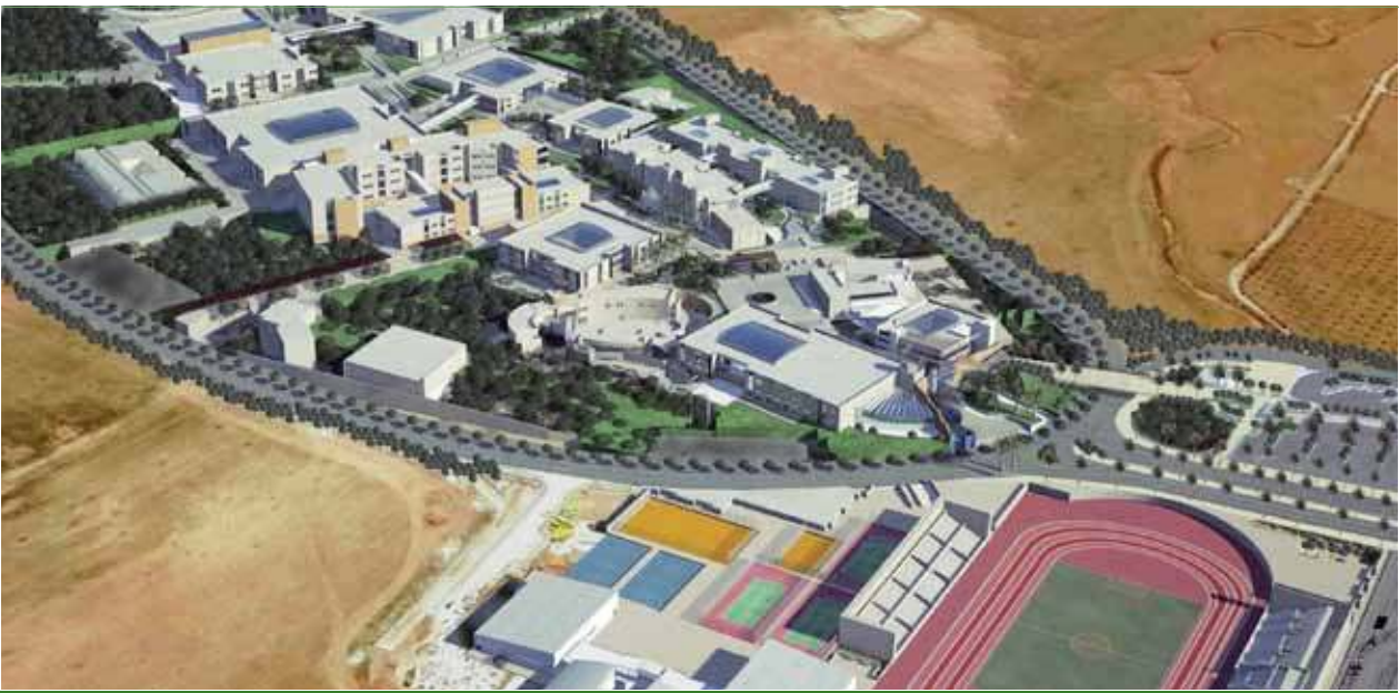
صورة جوية ثلاثية الأبعاد للجامعة الأمريكية في مادبا

أنهت الشركة القسم الأكبر من مشروع الجامعة (جامعة مادبا) وقامت بتسليمه وتشغيله حيث لاقى استحسان ورضى إدارة الجامعة حيث يعمل النظام حالياً في المبنى الأكبر ( كلية العلوم ) بقدرة 1 من أصل 1.6 ميغا واط والمرتبط إنهاؤها بأنهاء الأعمال الإنشائية في المباني الأخرى من قبل المقاولين الآخرين لتقوم شركة مينا بالتشغيل النهائي للمشروع. سيوفر نظام الطاقة الجوفية الحرارية الموجود في الجامعة الأمريكية في مادبا ما يعادل 300,000 كيلو واط من الكهرباء، 140,000 لتر من الديزل، وسيحفظ 310,000 كغ من انبعاثات غاز ثاني أكسيد الكربون سنوياً.