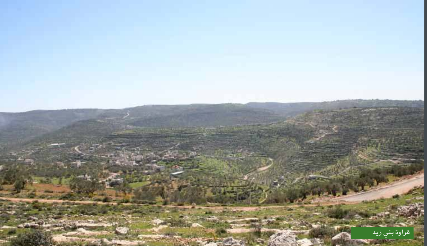
قراوة بني زيد