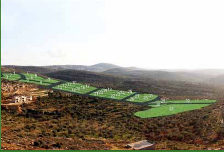
صور حقيقية تبين مخطط أحد الأراضي المعروضة في أحد مناطق مشروع طابو.

تمكن التكنولوجيا الفريدة والنظام الحديث الذي بني فيه الموقع الإلكتروني لمشروع طابو (www.TABO.ps) الفلسطينيين في جميع أنحاء العالم من حجز أراضي مشروع طابو في ثلاث خطوات، وتتولى الشركة متابعة كافة الإجراءات والمعاملات الرسمية المتبقية.